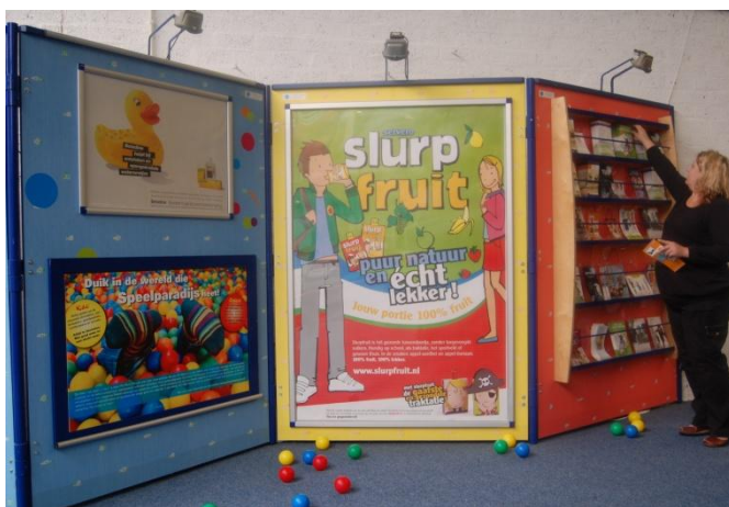
Gratis folderverspreiding bij alle speelparadijzen