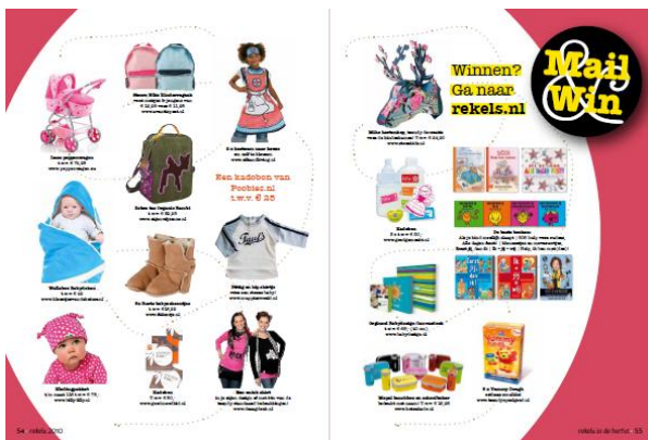
Deelnemers aan de mail&win worden extra uitgelicht in Rekels