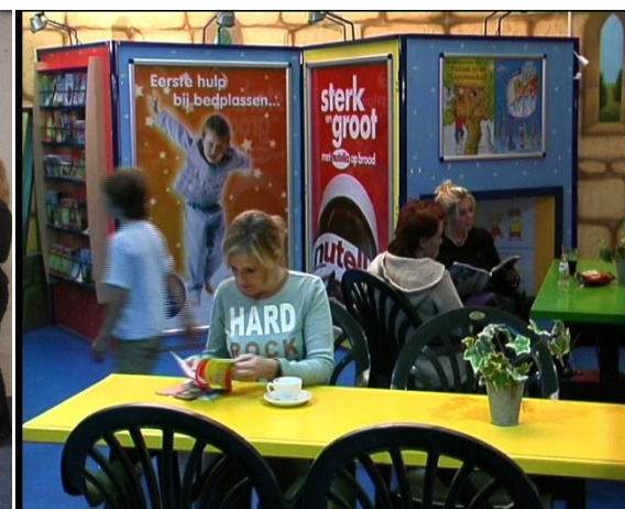
Moeders hebben hier tijd om te lezen