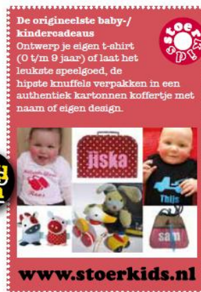
Rekels maakt de advertentie op waardoor het voor de lezer geen advertentie lijkt...