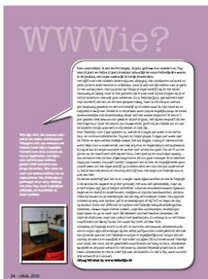
Deelname in het webwinkelkatern en redactionele aandacht